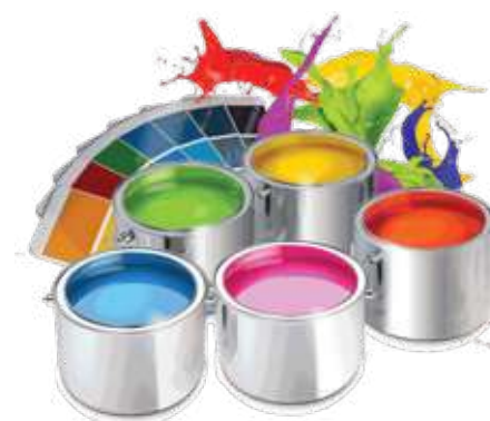
Personalizza con la verniciatura