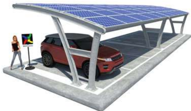
Kristal su Plinti