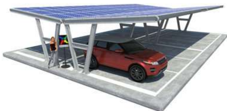
Katia su Plinti - doppia fila