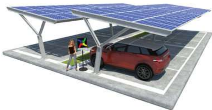
Yvonne su Plinti - doppia fila