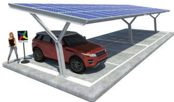
Yvonne su Plinti A