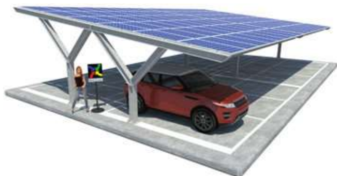
Jasmine su Plinti - doppia fila