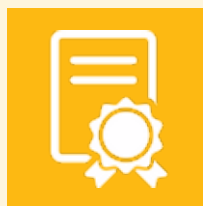
Permesso di costruzione

Il nostro intervento non include impianto e collegamenti elettrici