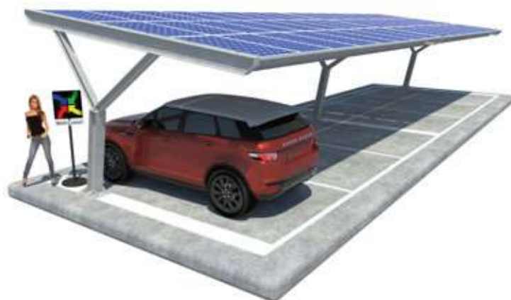
Yvonne su Plinti B