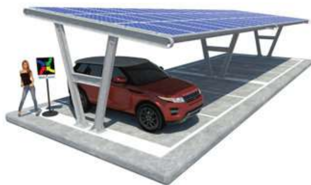
Vera su Plinti