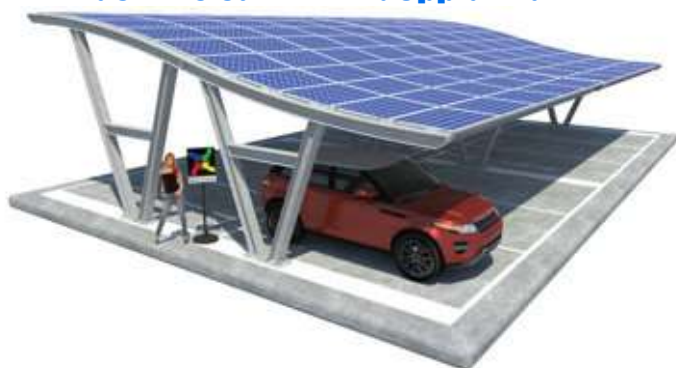
Viktoria su Plinti - doppia fila