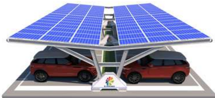
Nada zavorrata doppia fila