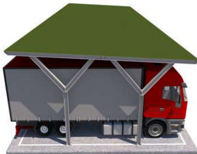
Yvonne su plinti