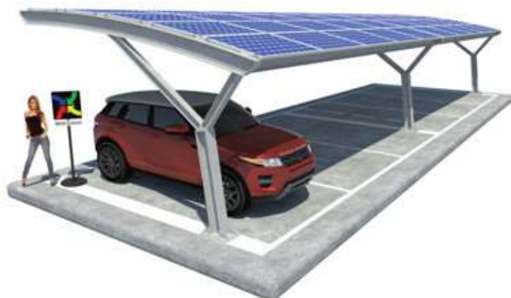
Paola su Plinti

Il nostro intervento non include impianto e collegamenti elettrici