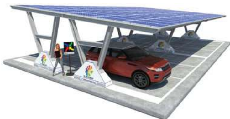
Katia Zavorrata - doppia fila