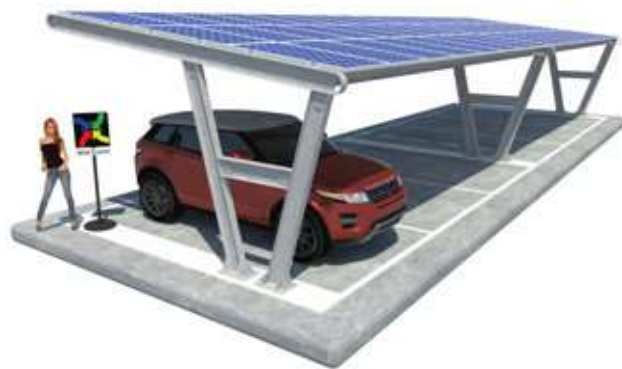
Katia su Plinti