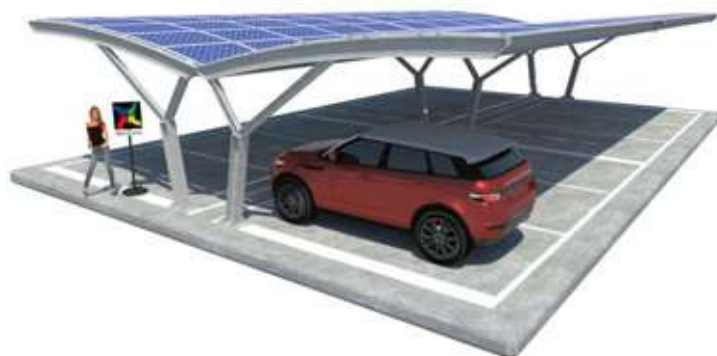
Jasmine su Plinti - doppia fila