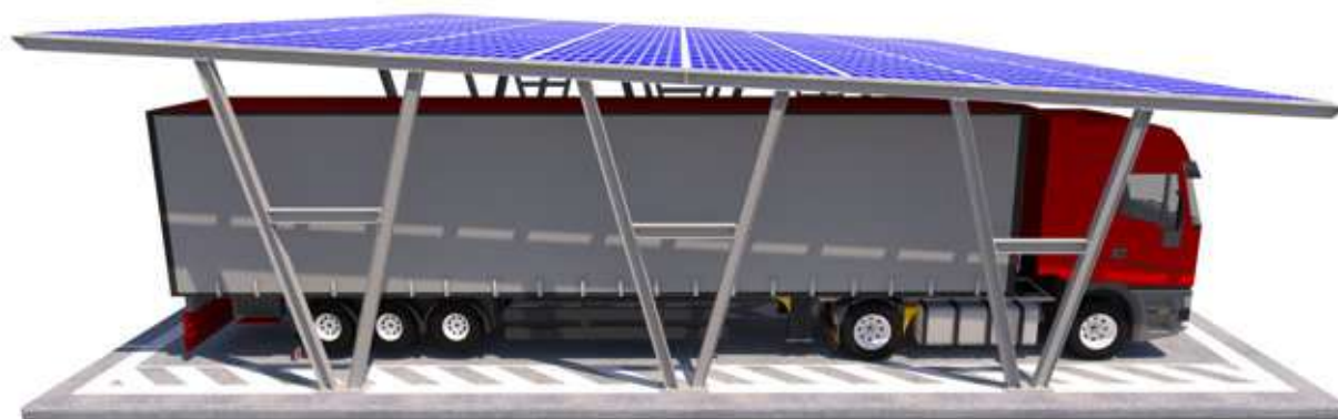
Emily su plinti

Il nostro intervento non include impianto e collegamenti elettrici