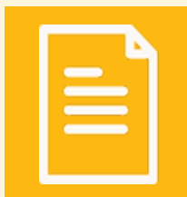
Scheda tecnica del modulo

Affinché i nostri tecnici possano fornire il miglior servizio possibile, è fondamentale che vengano forniti tutti i dati necessari alla formulazione della proposta: