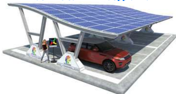
Viktoria Zavorrata - doppia fila