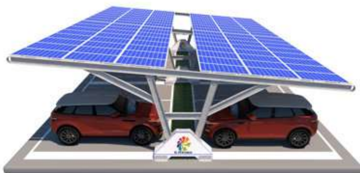
Natascia zavorrata doppia fila

Il nostro intervento non include impianto e collegamenti elettrici