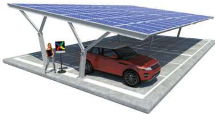
Yvonne su Plinti - doppia fila