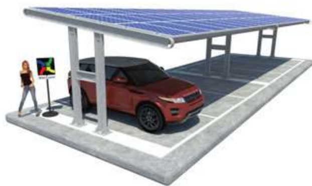
Cassandra su Plinti